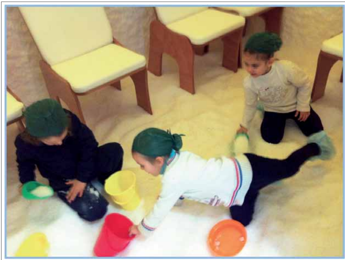
Fig. 2. Camera del sale per haloterapia Aerosal®: la compliance e l'aderenza al trattamento haloterapico è sempre molto alta. I piccoli pazienti vivono la seduta haloterapica più come un momento ludico che come trattamento terapeutico.