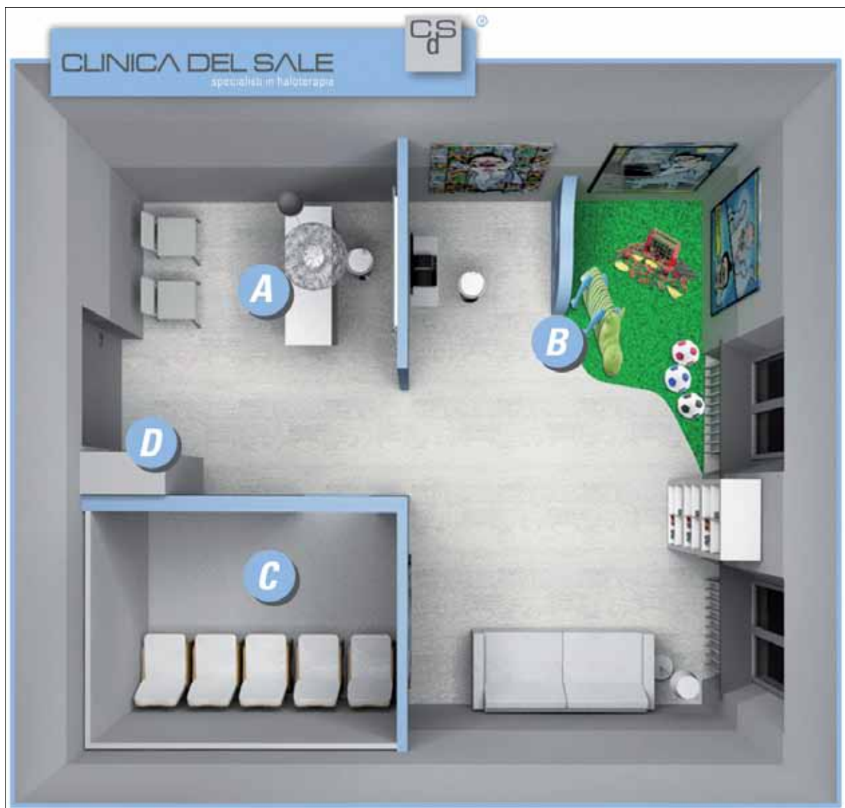
Fig. 1. "Clinica del Sale" ® .

termine sulla funzionalità polmonare; i revisori concludevano che ulteriori studi clinici randomizzati sarebbero stati necessari per dimostrarne l'efficacia nel trattamento dell'asma cronico in età pediatrica. Infine, sono noti ormai da qualche tempo gli effetti benefici del sale in ambito dermatologico. In particolare, nei pazienti affetti da dermatite atopica è stato descritto un miglioramento dopo HT 20 . I vantaggi della stessa nel trattamento della psoriasi non sono ancora noti sebbene uno studio abbia sottolineato gli effetti benefici degli ambienti salini nella zona del Mar Morto 21 .