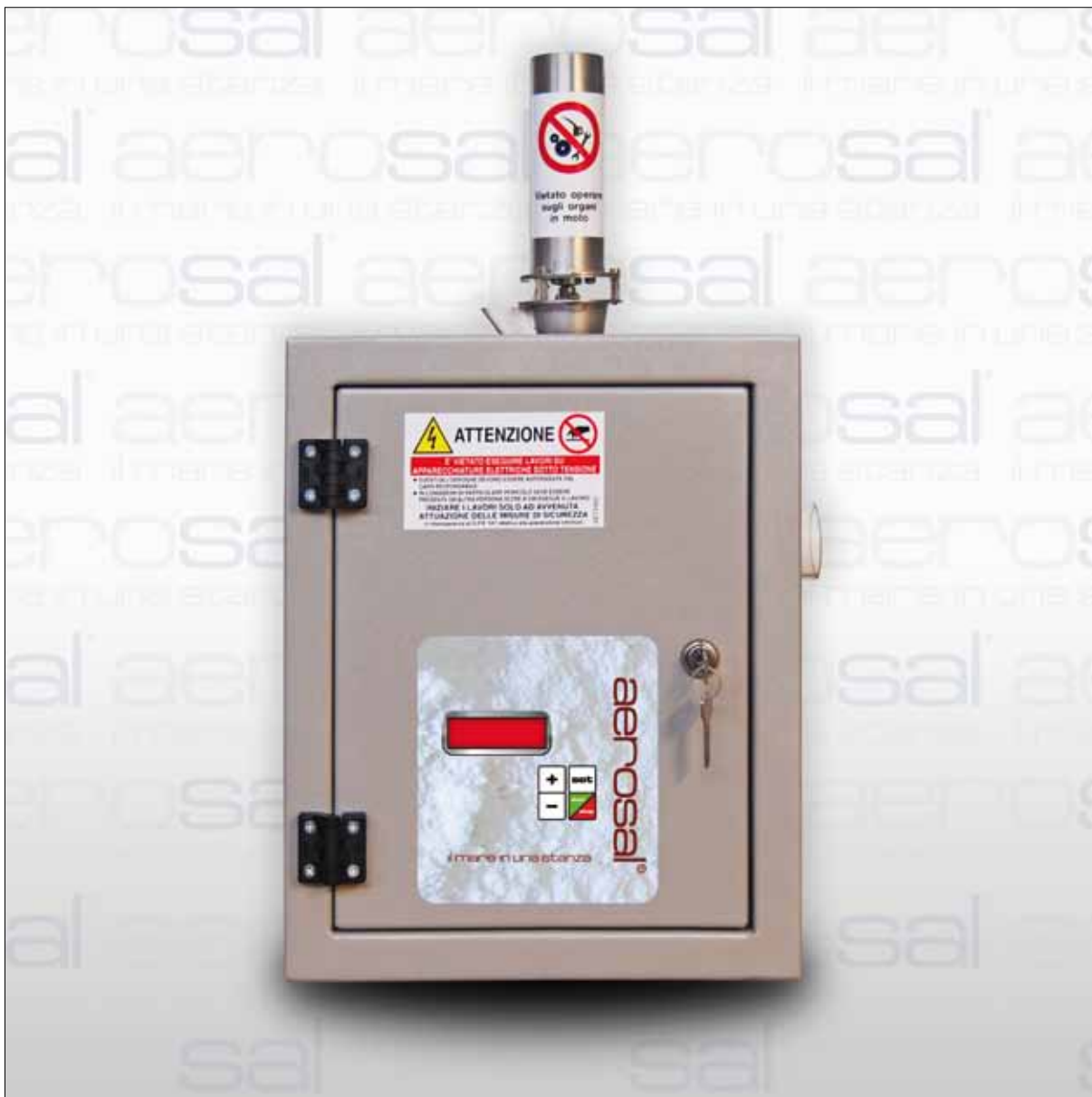
Fig. 3. Halogeneratore: Erogatore salino “a secco” micronizzato Aerosal®.