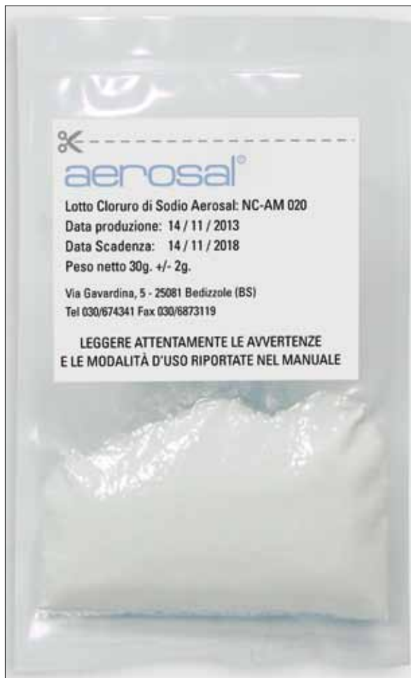
Fig. 4. Bustina di sale preconfezionata e sigillata.